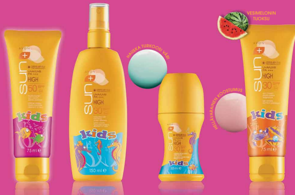
Vettä hylkivä monivitamiini-aurinkovoide

Valitse tuotteita, jotka on suunniteltu varta vasten lapsille - joissa on hellävaraiset koostumukset ja korkea suojakerroin.