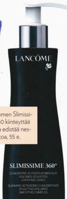
Lancômen Slimissime 360 kiinteyttää ihoa ja edistää nestekiertoa, 55 e.