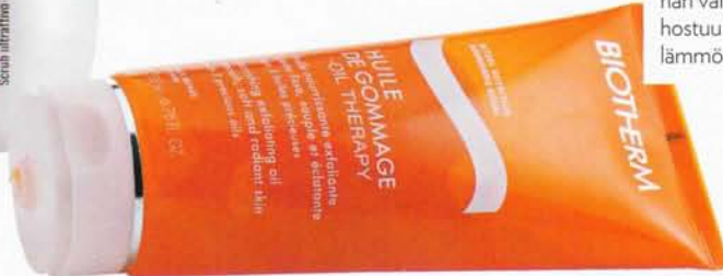
Biothermin Huile de Gommage -öljykuorinta myös ravitsee ihoa, 33 e.