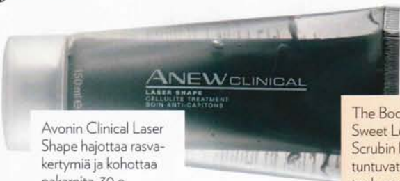
Avonin Clinical Laser Shape hajottaa rasvakertymiä ja kohottaa pakaroita, 30 e.