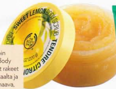
The Body Shopin Sweet Lemon Body Scrubin kuorivat rakeet tuntuvat tehokkaalta ja tuoksu on huumaava, 16,50 e.