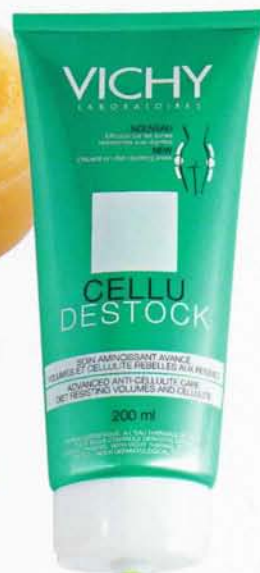
Vichyn Cellu Destock silottaa muhkurapaikoja ja kosteuttaa tehokkaasti, 26 e.