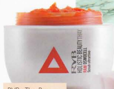
RVB:n Thay Ram-sarjan suolakkuorinta sisältää appelsiini-ihoa silottavia eeterisiä öljyjä, 83 e.