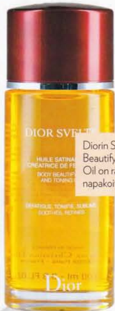
Diorin Svelte Body Beautifying and Toning Oil on ravitseva ja ihoa napakoittava öljy, 60 e.