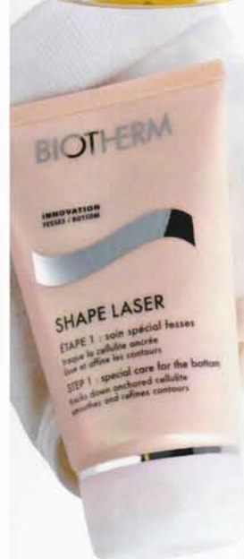
Biothermin Shape Laser Bottom Sculpting Kitistä löytyy takamuksen muokkaamiseen pehmentävä voide ja kofeiinimikrokapseleita sisältävät muotoilevat alushousut, 65 e.