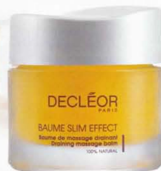
Decléorin Slim Effect on turvotusta vähentävä hierontabalsami, 56 e.