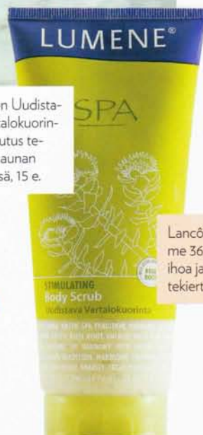
Lumene Uudistavan Vartalokuorinnan vaikutus tehostuu saunan lämmössä, 15 e.